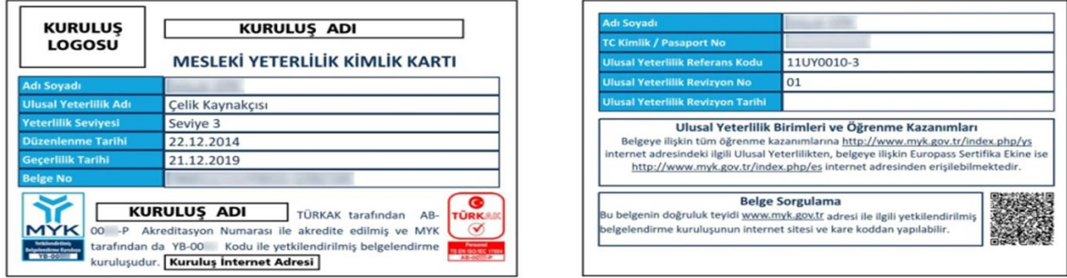
Şekil 2 MYK Mesleki Yeterlilik Kimlik Kartı